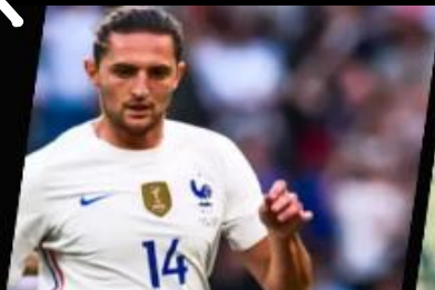
Partenaire de la FFF Partenaire du PSG / OL / OM