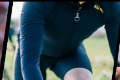
Partenaire officiel du Tour de France