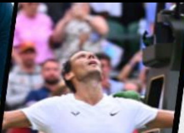
Fournisseur officiel de Roland Garros