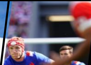
Partenaire du XV de France et de la FFR